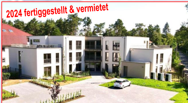
2024 fertiggestellt & vermietet

Seniorengeeignete Wohnungen mit optionaler Betreuung durch mobilen Pflegedienst – kein Pflegeheim Neubau in 06862 Dessau-Roßlau | Attraktive Rendite-Kapitalanlage als Teileigentum